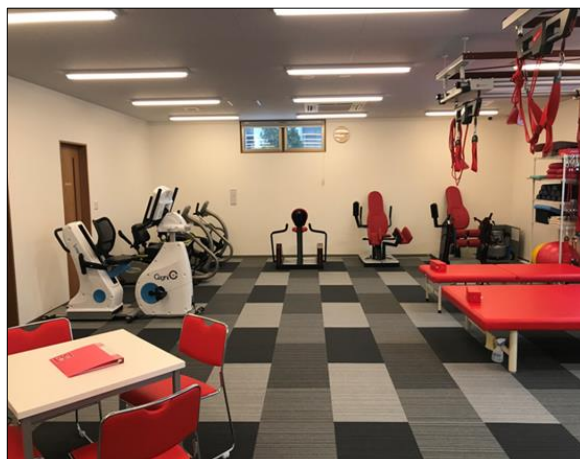
「元氣ジム秋田山王」 外観・室内