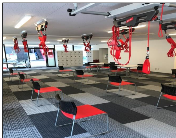
「ルネサンス 元氣ジム練馬」外観・室内