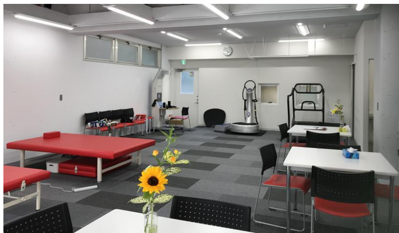
ルネサンス リハビリセンター鎌倉