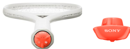
テニスのショットを即時分析できるテニスラケット装着型の Smart Tennis Sensor (スマートテニスセンサー)『SSE-TN1S』

ショット毎のデータを映像と同期して記録・再生することができます。映像をショット単位で早送りする、気になるショットを繰り返し見る、特定の種類のショットだけを抜き出して見る、など様々な方法で再生することができます。