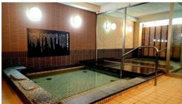
ルネサンス名古屋熱田